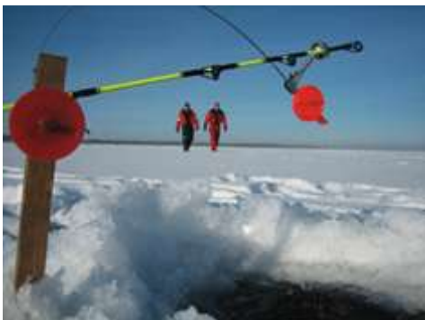
på säkerheten vid fiske från is.